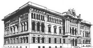
Museo Civico di Storia Naturale "G. Doria"